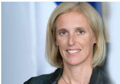
Ségolène Neuville Secrétaire d'état auprès de la ministre des Affaires sociales et de la Santé, chargée des personnes handicapées et de la Lutte contre l'exclusion

Il existe encore aujourd'hui de trop nombreux préjugés qui affectent la vie quotidienne des enfants et adultes autistes, et ce, dès leur plus jeune âge. Les troubles du spectre de l'autisme sont en effet mal connus du grand public, et font l'objet d'une information disparate, incomplète, quand elle n'est pas tout simplement erronée.