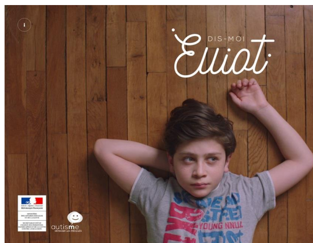
Captures d'écran du film ainsi que du site internet www.dismoielliott.fr