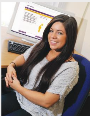
La formation en ligne "Ask" de la National Autistic Society est dispensée par des personnes avec autisme.avec autisme.

Ask Autism est un service de formation de la National Autistic Society pour le développement professionnel. Conçu et donné par des personnes avec autisme elles-mêmes, Ask Autism permet aux professionnels et autres acteurs concernés de découvrir l'autisme « de l'intérieur » et la manière dont les personnes avec autisme souhaiteraient être comprises et soutenues.