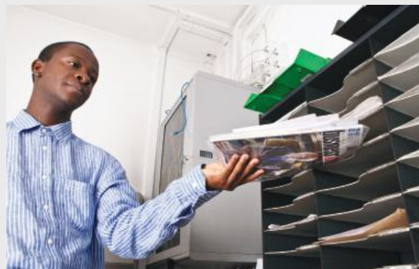
Tri du courrier à Glasgow, Ecosse, dans le cadre de l'initiative Prospects.

Une étude pilote de deux ans, dans le cadre de l'initiative « Prospects » 83 , a permis de comparer les résultats en terme d'emploi entre deux groupes de personnes avec autisme : le premier groupe avait reçu un soutien spécifiquement conçu pour répondre aux besoins des adultes avec autisme dans le cadre de l'initiative Prospects, tandis que le second groupe avait bénéficié d'un programme de soutien général pour personnes handicapées.