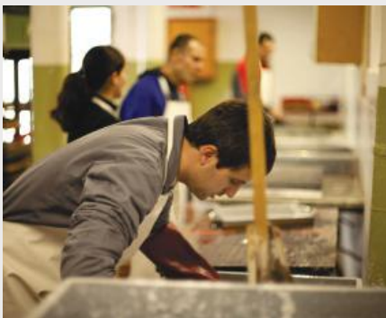
Recyclage de papier chez TERLAB.

Les adultes avec autisme requérant un haut niveau de soutien peuvent éprouver de grandes difficultés à trouver un emploi adéquat. TERLAB, un atelier protégé situé près de Barcelone, Espagne, leur offre la possibilité de prendre à part à des activités utiles dans le domaine de l'agriculture, du jardinage et du recyclage de papier.