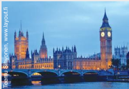
Le Parlement britannique a adopté l'Autisme Act en 2009, première loi spécifique au handicap en Angleterre.

Cette loi requérait que le gouvernement développe une stratégie afin de répondre aux besoins des adultes avec autisme, ainsi que des directives officielles à l'intention des autorités et des services locaux de soins de santé pour sa mise en œuvre. Dès lors, en 2010, la stratégie « Fulfilling and Rewarding Lives » (Stratégie pour des vies épanouies) a été créée pour garantir que les personnes avec autisme reçoivent le soutien nécessaire, de l'aide à domicile jusqu'à l'aide à l'emploi.