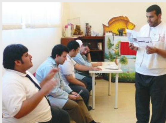
Un assistant d'éducation avec les étudiants.

Les quatre membres du personnel avec autisme travaillent comme bibliothécaires ou assistants de cours pour les étudiants avec autisme qui suivent une formation pour apprendre la géographie et les sciences sociales, développer leurs compétences professionnelles dans les domaines de la menuiserie ainsi que des aptitudes pour la vie quotidienne.