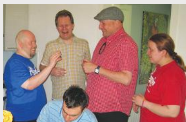
Bénévoles travaillant pour le magazine en ligne Puoltaja.

Puoltaja est un magazine en ligne créé en Finlande par des bénévoles avec autisme, pour la plupart atteints du syndrome d'Asperger.