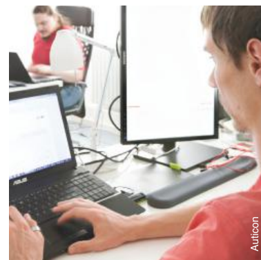
Consultants informatiques en Allemagne.

L'insertion professionnelle des personnes avec autisme dans le monde du travail ordinaire nécessite souvent la mise en place de diverses formes de soutien, comme cela a été évo-