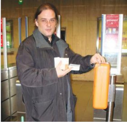
Des employés de Passwerk en déplacement, testant des portillons d'accès dans les stations de métro.

L'entreprise belge Passwerk emploie une quarantaine de personnes avec autisme pour effectuer des tests de logiciels et participer à des projets de tests de qualité, à la fois dans les bureaux de l'entreprise et sur les lieux des différents projets.