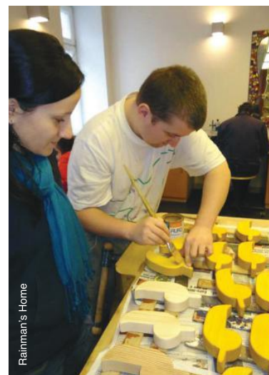
Développement de compétences en menuiserie avec une aide spécifique en Autriche.