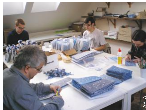
Emballer des cadeaux en République tchèque.