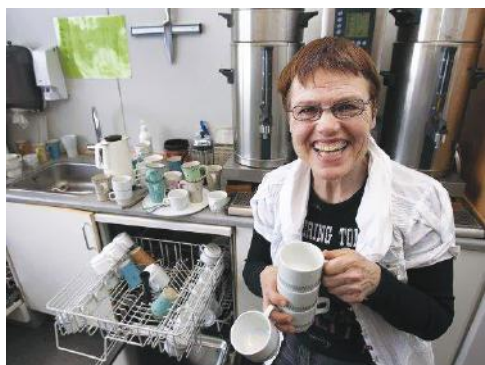
Préparer le café et assister les enseignants dans une école au Danemark.

Si les personnes avec autisme ont besoin d'aide pour accéder à l'emploi et se maintenir dans l'emploi, elles ont également besoin de compétences pour défendre leurs droits. Dans la mesure du possible, les personnes avec autisme devraient bénéficier d'une formation pour leur permettre de développer les compétences nécessaires pour défendre leurs droits et leurs besoins dans le contexte professionnel.