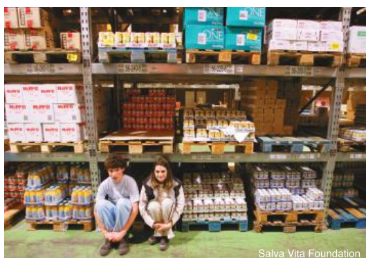
En formation professionnelle dans un entrepôt en Hongrie.

L'éducation est un facteur clé pour accéder à l'emploi. Comme nous l'avons déjà indiqué dans ce présent rapport, les enfants et les adultes avec autisme sont encore trop souvent exclus des systèmes éducatifs. Il est dès lors indispensable que les gouvernements adoptent des politiques et des stratégies nationales qui assurent l'accès à l'éducation tout au long de la vie, depuis les structures d'accueil pour enfants en âge préscolaire jusqu'à l'éducation supérieure, y compris la formation professionnelle. Il faut également offrir aux personnes avec autisme des formations qui permettent de préserver et d'améliorer les capacités acquises dans les domaines de la communication, des interactions sociales et personnelles afin de compenser leurs difficultés dans ces domaines.