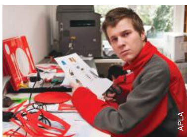
Développement de compétences en République tchèque..

Le terme 'ateliers protégés' fait communément référence à une organisation ou à un environnement qui emploie des personnes handicapées séparément des autres. 85 Ces ateliers s'adressent en général à des personnes handicapées qui exercent un métier manuel. Ils peuvent avoir plusieurs formes, comme des centres d'accueil de jour où les personnes handicapées participent à des programmes d'ergothérapie axés sur la production de biens et de services à des fins non lucratives, ou des centres où les personnes handicapées exercent des activités pour lesquelles elles reçoivent un revenu.