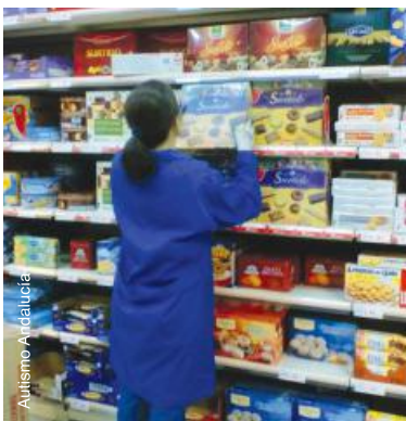
Réapprovisionnement et rangement des rayons dans un supermarché en Espagne.