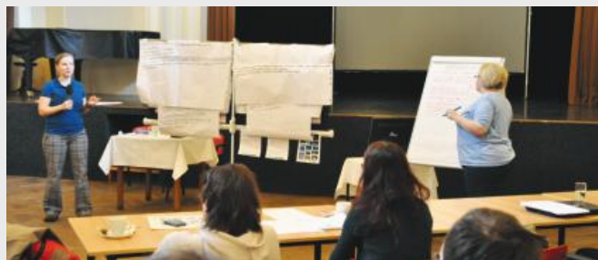
Réunion entre les parties prenantes dans le cadre du projet We Can Manage.

Le projet rassemble des organisations travaillant avec les personnes avec autisme et d'autres groupes comparables pour évaluer les approches de l'emploi dans différents pays.