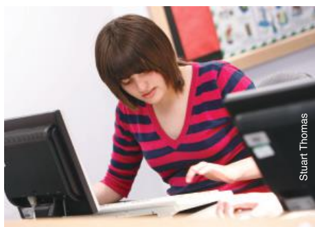
Travail sur ordinateur au Royaume-Uni.