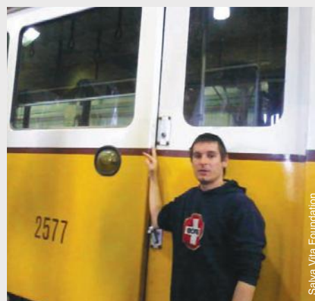
La Fondation Salva Vita a aidé un jeune homme passionné de trains et aimant le nettoyage à obtenir un emploi en tant que nettoyeur de trams.