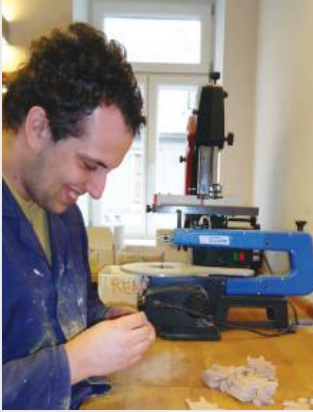
Travail du bois chez Rainman's Home.

Le premier module (« de base ») porte sur les aptitudes de base à communiquer et sur les aptitudes à la vie quotidienne, comme la cuisine.