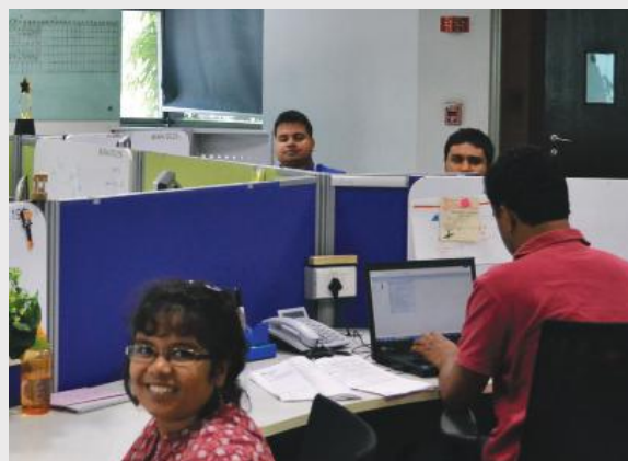
Des salariés avec autisme de SAP en Inde reçoivent un soutien individuel

Aujourd'hui, l'organisation opère dans une douzaine de pays et a déjà permis à plusieurs centaines de personnes avec autisme de décrocher un emploi, la majorité d'entre elles travaillant pour Specialisterne même.