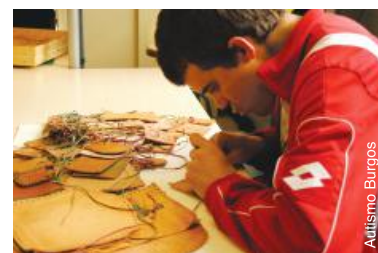
Fabrication d'accessoires en cuir en Espagne.