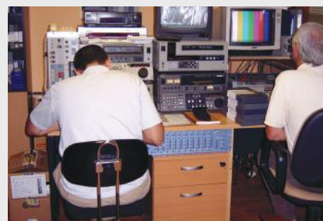
Assistants techniques archivant des bandes vidéo.

Le programme – le premier du genre dans le sud de l'Espagne – a été lancé en 2006. Depuis lors, il a permis d'aider 120 personnes avec autisme, âgées de 17 à 50 ans, et pour la plupart ayant un bas niveau de formation, à trouver un emploi. Le programme a contribué à la création d'une