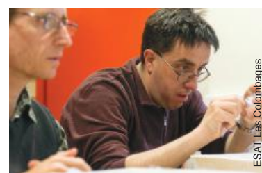
Travailler dans de petites équipes pour éviter le stress en France.