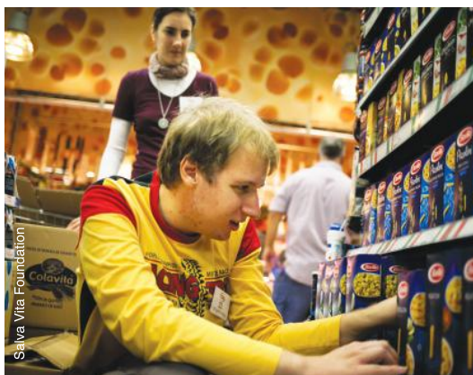
Réapprovisionnement des rayons en Hongrie.