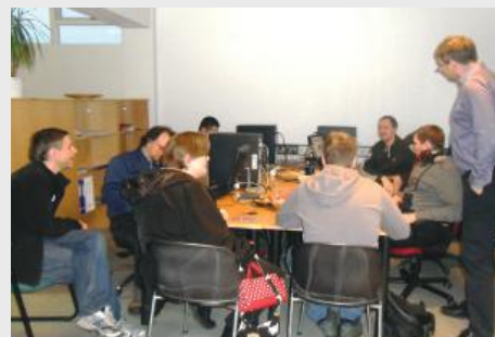
Specialisterne en Islande offre une formation professionnelle aux adultes avec autisme pour les aider à trouver un emploi.