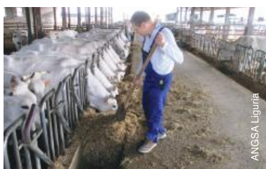
Soigner le bétail dans une ferme en Italie.