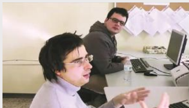
Des membres du personnel de la coopérative discutent de leur travail.

En Italie, un groupe d'adultes avec autisme qui ne parvenaient pas à trouver un travail satisfaisant et adapté sur le marché libre du travail ont créé une coopérative au sein de laquelle ils collaborent.