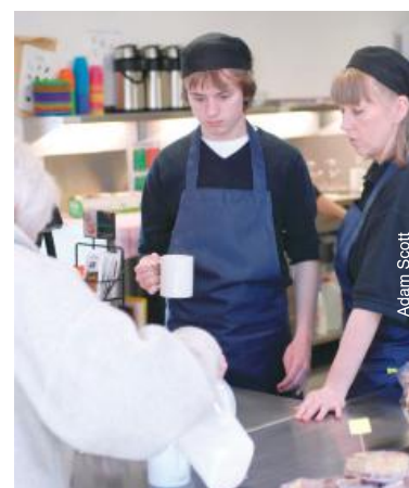
Travail à la cantine au Royaume-Uni.