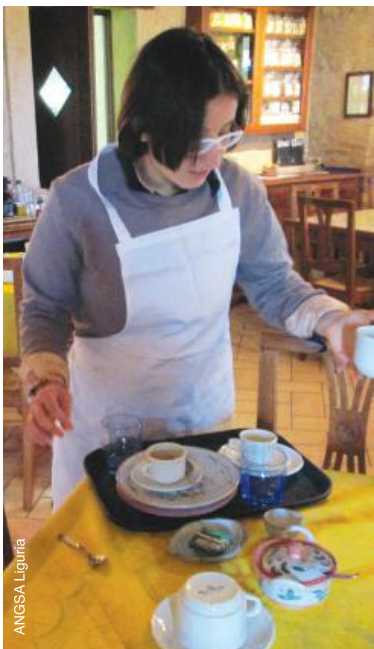
Travail dans une cantine en Italie.

L'autisme est un trouble du développement permanent qui affecte la façon dont une personne communique et interagit avec les autres. Ce trouble affecte également la manière dont elles perçoivent le monde qui les entoure. L'autisme couvre un spectre de troubles, ce qui signifie que même si toutes les personnes avec autisme partagent certaines difficultés, leurs troubles les affecteront de manière différente. Certaines personnes sont capables de vivre en relative autonomie alors que d'autres peuvent avoir des troubles d'apprentissage assortis et requérir une assistance spécialisée durant toute leur existence.