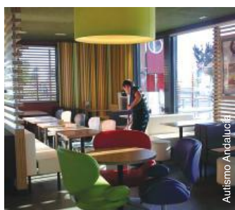
Travail de nettoyage dans un McDonalds en Espagne.

rôle de manière adéquate et qui définit les structures de soutien au sein de son environnement de travail. Dès que la personne avec autisme possède les compétences requises pour exercer son rôle de manière indépendante, l'aide du mentor professionnel se réduit à des consultations périodiques ou à un soutien par téléphone pour veiller à ce que la personne avec autisme puisse maintenir son emploi. Cette approche vise à rendre la personne la plus autonome possible dans le cadre de sa fonction, l'assistance sera réduite au minimum, mais ne sera cependant jamais complètement enlevée. Cette approche s'applique pour les personnes avec autisme qui sont capables de travailler en milieu de travail ordinaire avec une assistance limitée.