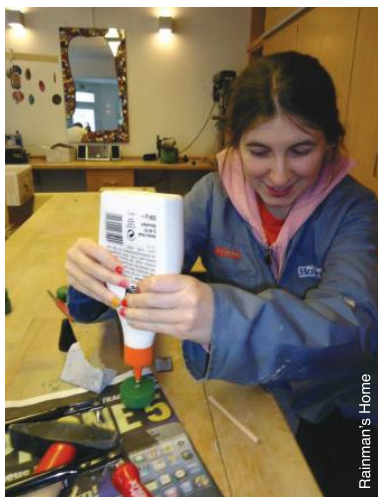
Développer des compétences en menuiserie en Autriche.

Les critiques formulées à l'encontre des ateliers protégés portent surtout sur la ségrégation et l'exploitation des personnes handicapées et sur la négation de leurs droits fondamentaux, comme ce fut le cas dans certains ateliers. On peut citer l'exemple des ateliers où les personnes handicapées exercent un métier qui est en dessous de leurs capacités, pour une paie inférieure au salaire minimum, à la faveur des organisations qui exploitent leur force de travail et qui leur offrent peu, sinon aucune possibilité pour développer les compétences nécessaires pour intégrer le marché de l'emploi ordinaire. 86 Les personnes avec autisme qui travaillent dans les ateliers protégés ont souvent vécu en institutions, et leur occupation dans les ateliers protégés n'émane pas toujours du libre choix de la personne ou des membres de la famille. 87 Clairement, ces pratiques ne peuvent, en aucun cas, être considérées comme acceptables.