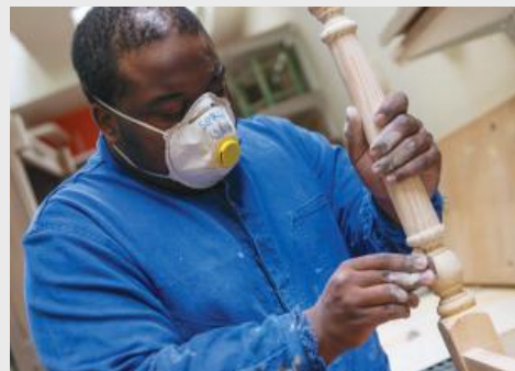
Restauration de meubles à l'ESAT les Colombages.

L'organisation gère 5 ateliers où les employés avec autisme produisent des biens et services. Ces derniers sont vendus au public, notamment dans le magasin de l'ESAT qui emploie aussi des personnes avec autisme.