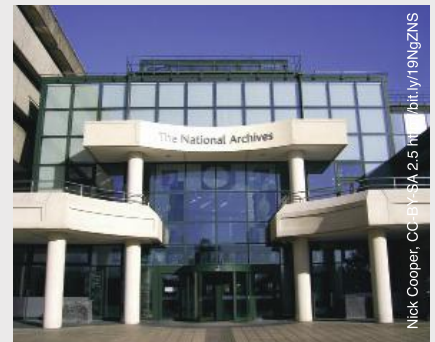
The National Archives building in London, United Kingdom.

En savoir plus : www.autism.org.uk/employmentservices