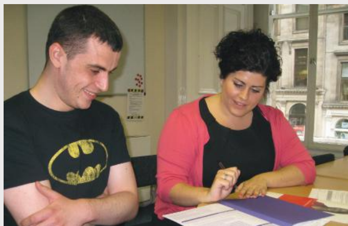
Coopération au sein du Service de consultation et de formation pour l'emploi de la National Autistic Society.

Etant donné le nombre de personnes concernées par ce secteur en expansion, la National Autistic Society a développé une méthode pour aider les employeurs, les intermédiaires et les organismes de soutien aux personnes avec autisme à développer avec ces dernières des relations professionnelles constructives.