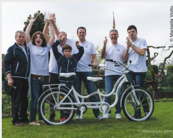
L'équipe Godega4Autism avec l'un de ses « hug bikes »

Depuis janvier 2014, deux adultes avec autisme y exercent un emploi. L'un d'eux requiert un haut degré de soutien. Les employés sont encadrés par un superviseur et un éducateur ABA. Dès lors, l'éducation continue et le développement de compétences font partie intégrante de leur travail.