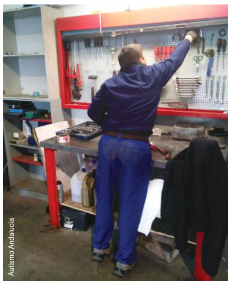
Assistant-mécanicien triant des outils en Espagne.