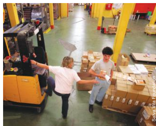
Travail dans un entrepôt en Hongrie.

Lorsque des possibilités d'avancement de carrière se présentent, les personnes avec autisme auront sans doute besoin d'encouragement et d'un soutien supplémentaire. Il peut s'agir d'un soutien dans le cadre des discussions et des négociations relatives à leur nouveau rôle et à leurs nouvelles responsabilités, ou d'adaptation raisonnable pour répondre à leurs besoins au cours de la transition vers leur nouvelle fonction. De par la nature même de l'autisme, de nombreuses personnes avec autisme préfèrent éviter les changements de routine et/ou de leur environnement physique, susceptibles de provoquer un stress extrême. Tout en respectant cet aspect, il ne faudrait toutefois pas éviter les possibilités d'avancement de carrière sur cette base. Il faudrait plutôt veiller à assurer un soutien adéquat au cours du processus d'avancement de carrière.